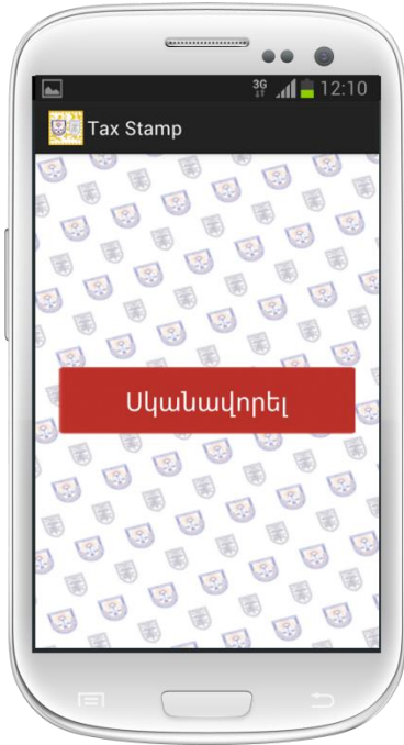
Քայլ 5 – Հեռախոսի տեսախցիկը մոտեցրեք դրոշմապիտակին այնպես, որ նրա barcode (2d code) լինի էկրանի ճիշտ մեջտեղում՝ քառակուսի նշման մեջ: