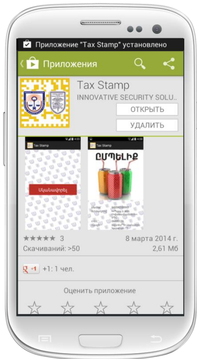
Քայլ 4 – Ծրագիրը տեղադրելուց հետո բացեք այն և սեղմեք Սկանավորել կոճակը: